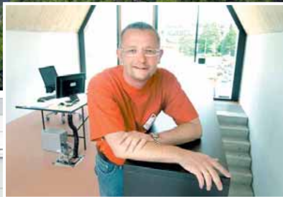
uert arer e ti ch ann e ei tert irmenche al S lar i