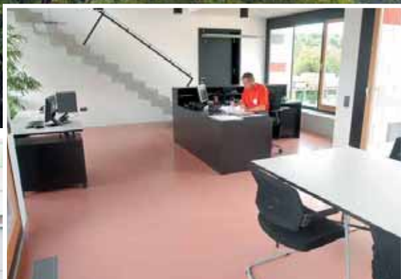
u ti un re u iert a er te üro e cho mit ar i em trich